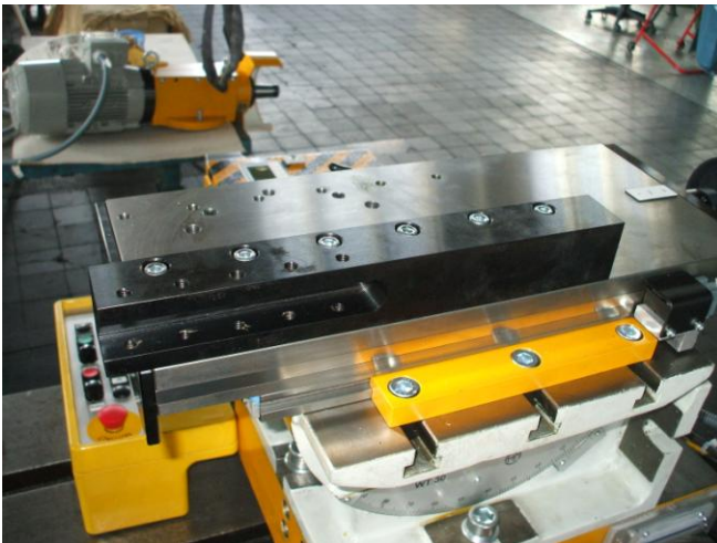
Bilder: Detail Aufnahme Drehstahl,